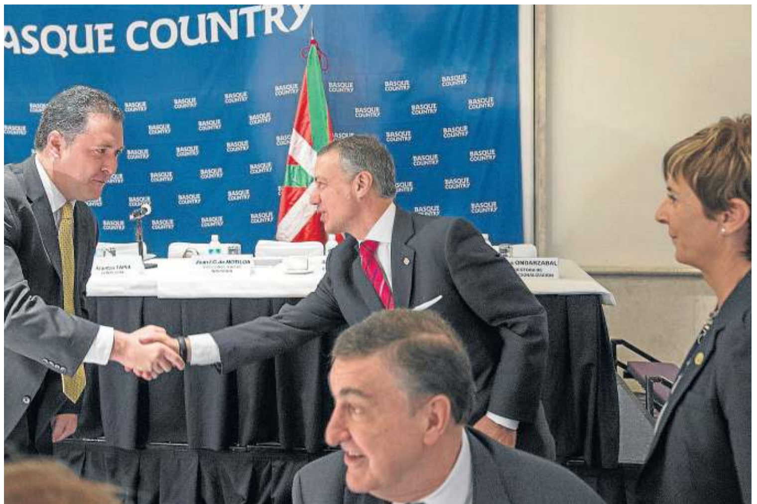
Urkullu en un momento de su reunión con empresarios en presencia de la consejera Arantza Tapia.

● Empleo. En cuanto al empleo, Euskadi es una de las cuatro comunidades autónomas en las que se ha producido un descenso de la ocupación de un 0,2% interanual y de un 0,5% respecto a agosto. El empleo en el sector sólo descendió en cuatro comunidades autónomas, que fueron, además de la CAV, la Comunidad de Madrid, Aragón y Asturias.